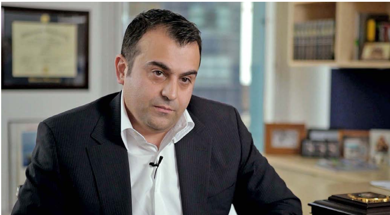
Ali Soufan critica les tàctiques de tortura de la CIA, la contractació d'interrogadors sense experiència i l'exclusió de l'FBI després de l'11-S.