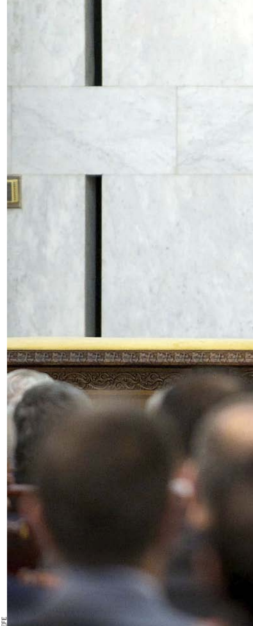
El dictador sirianès no ha renunciat al somni de

Era evident que Damasc havia fet tot el possible per esborrar qualsevol