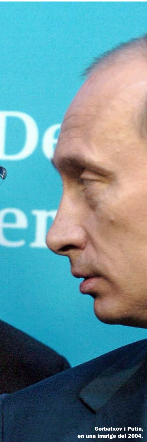
Gorbatxov i Putin, en una imatge del 2004.

ja ningú no havia de patir més per les tropes russes. Ara torna a haver-hi aquesta por.