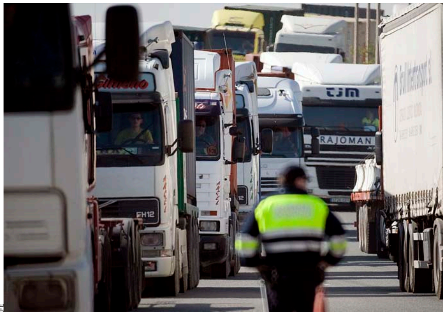
Embús a la carretera V-30 durant la vaga d’estibadors de 2009.