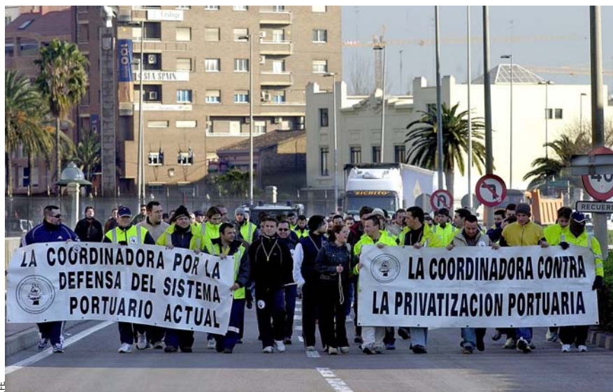
Estibadors es manifesten l'any 2003 contra la directiva de la UE que perseguia liberalitzar els serveis portuaris.

asseure's a negociar-lo amb patronal i sindicats. El Govern espanyol té davant seu dues opcions: la primera, fer algunes modificacions aparents que no canvien el model actual en la seua essència; la segona, posar fi al monopoli autoimposat per llei i liberalitzar el sector. “No s'hauria de desaproveitar