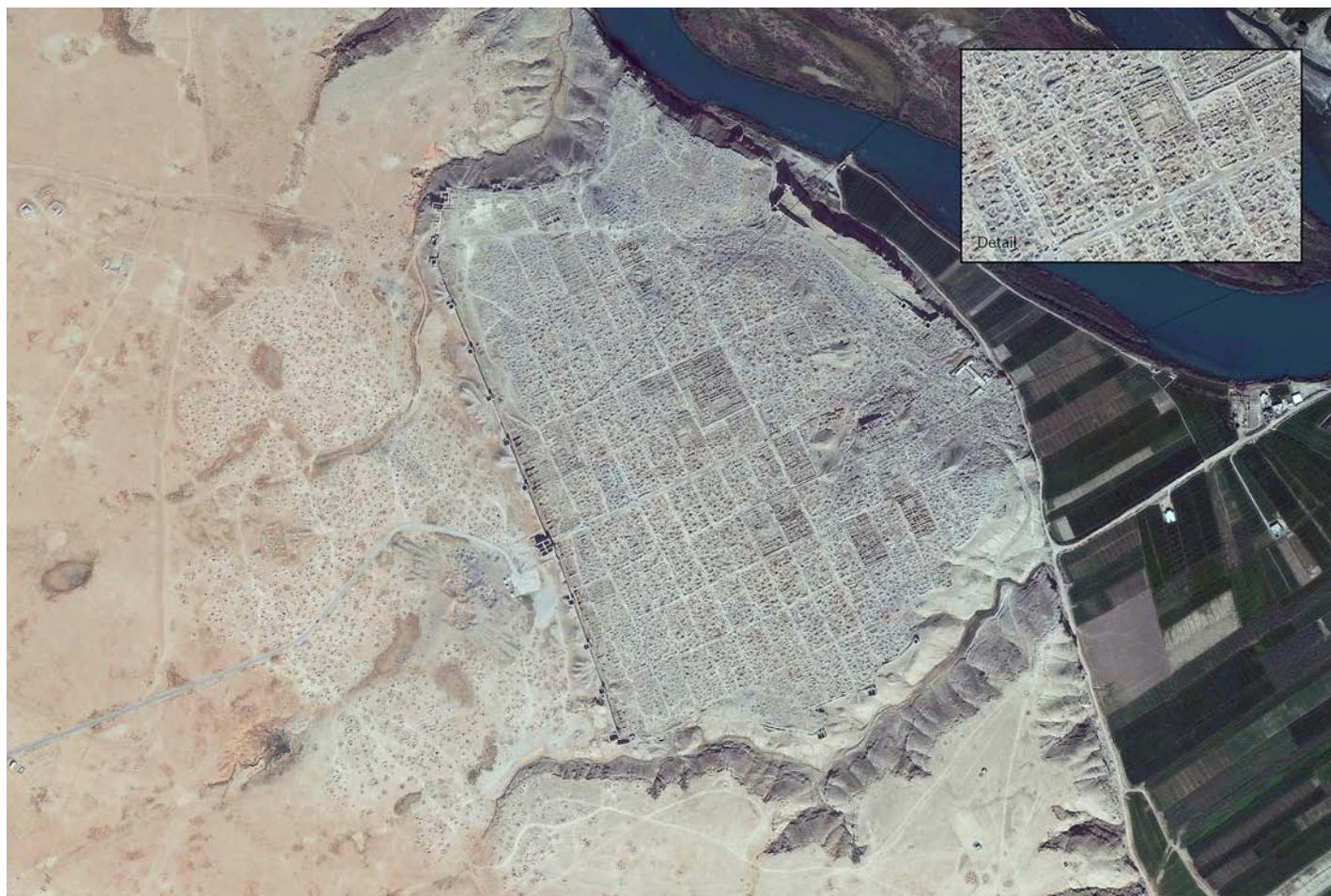
Els últims i pitjors casos de saquejos han tingut lloc a Síria i a Iraq. El Departament d'Estat d'EUA n'ha publicat diverses imatges per satèl·lit.