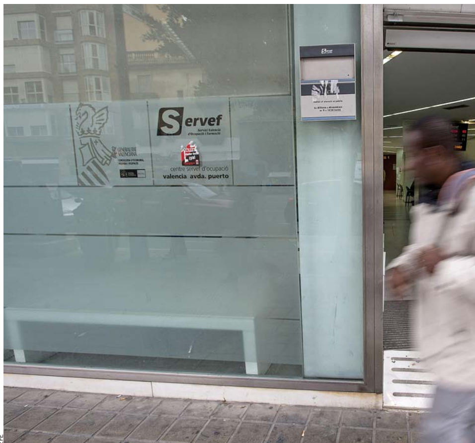
Al País Valencià la taxa d'atur ha baixat del 27,2% del quart trimestre de 2013 al 23,5% de