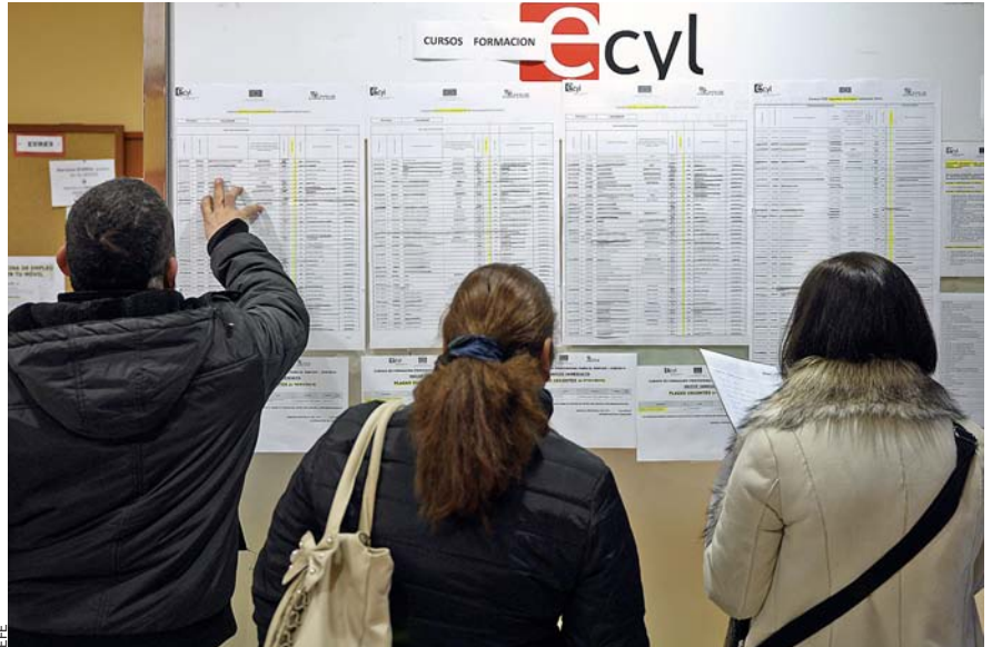
Els experts reclamen orientadors laborals que ajuden a reinserir al mercat laboral els desocupats de llarga durada.