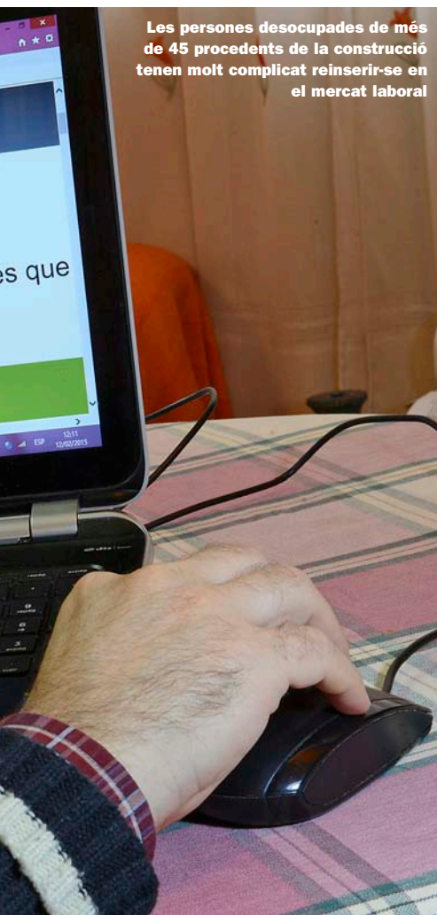
Les persones desocupades de més de 45 procedents de la construcció tenen molt complicat reinserir-se en el mercat laboral

va afanyar a prometre la creació d'entre 75.000 i 100.000 llocs de treball durant 2015. Potser la promesa de Fabra resulta excessivament optimista, però en una cosa té raó el cap del Consell: la tendència destructiva del mercat de treball ha començat a canviar. L'afirmació és certa i ben certa si ens cenyim a l'anàlisi freda de les xifres, tant pel que fa a Espanya com als Països Catalans en concret. El nombre de persones desocupades va disminuir en més de 222.000 durant 2014 als Països Catalans. La baixada pot deure's en part al fet que alguna gent va desistir de continuar buscant un lloc de treball, però la magnitud de la xifra assenyala que el mercat de treball es recupera. Les Illes és el territori on el descens va ser més acusat, amb una disminució de la taxa d'atur de 3,8 punts, passant del 22,7% al 18,9%, seguida de molt prop pel País Valencià (un descens de 3,7 punts, ja que ha baixat del 27,2 al 23,5%). Al Principat la disminució va