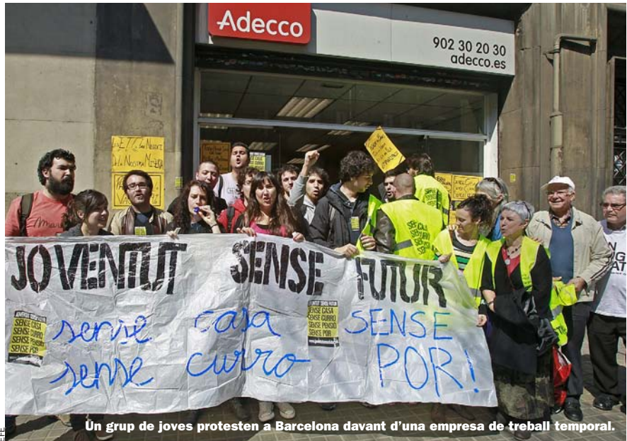
Un grup de joves protesten a Barcelona davant d’una empresa de treball temporal.

pectives encara empitjoren a la vista de les advertències dels investigadors socials. “La magnitud d’aquesta crisi no és com les anteriors –explica Cueto, de la Universitat d’Oviedo i una de les expertes que ha participat en el prestigiós Informe sobre exclusió i desenvolupament social a Espanya, Foessa, de Caritas–. La crisi de finals dels 80 i principis dels 90, va afectar a les persones de 45 anys, però es van recuperar més ràpid que no ara. Ara la recuperació és molt més lenta i els desocupats romanen molt més temps fora del mercat. En aquella crisi l’expulsió va ser només temporal; ara no sabem quant durarà ni tampoc sabem ben bé què passarà amb els desocupats de llarga durada”. De manera immediata, en canvi, els efectes són ben visibles: en l’aspecte psicològic, el desànim que suposa sentir-se exclòs acaba desembocant en moltes ocasions en quadres depressius i en situacions d’exclusió social i desestructuració personal; en l’aspecte de l’economia domèstica, la desocupació prolongada deriva, quasi sempre, en un empobriment familiar.