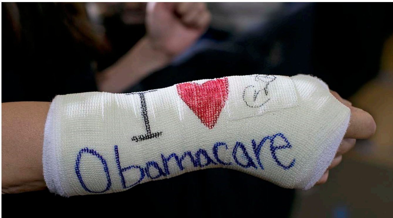
La llei sanitària d'Obama ha introduït mesures perquè els metges no tinguin la temptació d'operar només per tenir més ingressos.