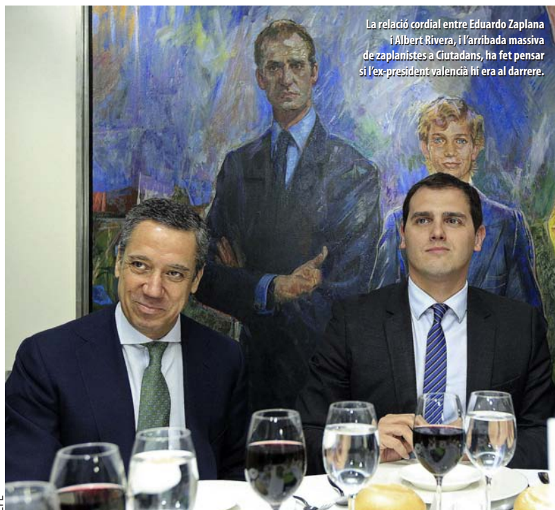
La relació cordial entre Eduardo Zaplana i Albert Rivera, i l'arribada massiva de zaplanistes a Ciudadanos, ha fet pensar si l'ex-president valencià hi era al darrere.