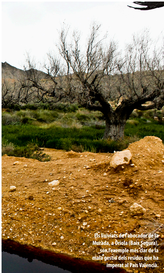
Els lixivis de l'abocador de la Murada, a Oriola (Baix Segura), són l'exemple més clar de la mala gestió dels residus que ha imperat al País Valencià.