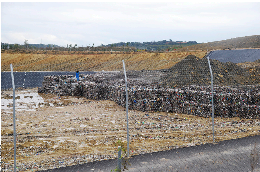
Una perspectiva de la planta de residus de Cervera del Maestre (Baix Maestrat), gestionada per tres empreses.