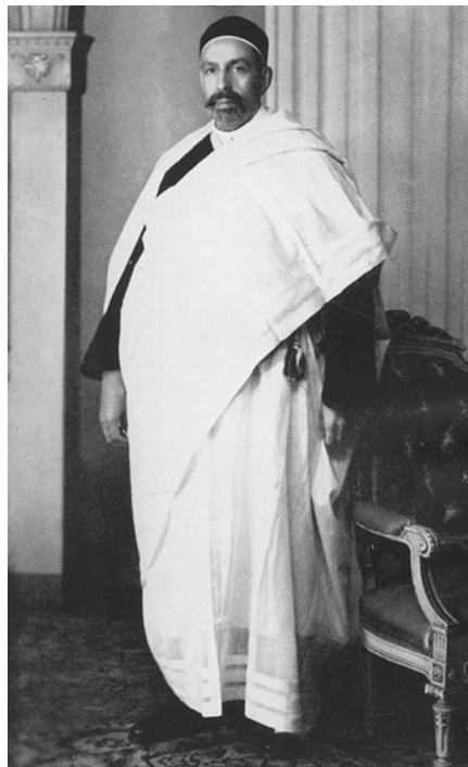
Rei Idris I, derrocat el 1969 per Gaddafi.