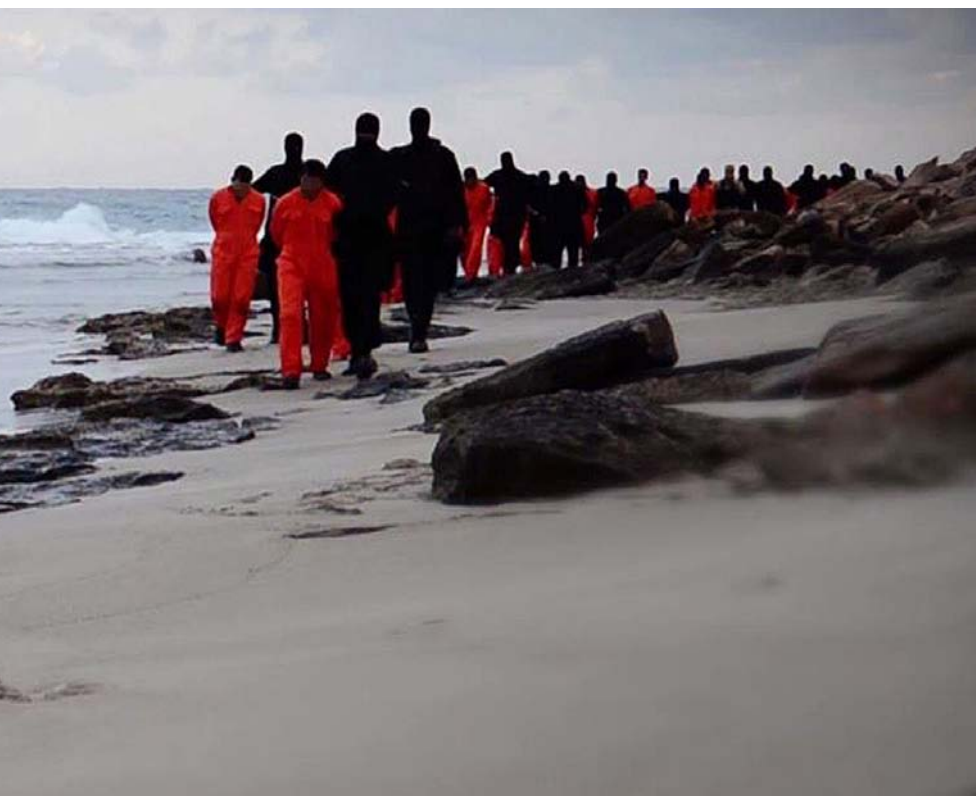
AL-QAIDA. A l'esquerra, membres d'Estat Islàmic abans de decapitar –segons el mateix EI– els seus ostatges coptes. A sota, membres del grup d'Al-Qaida CMXD (Consell Mujaidí de la Xura de Derna).