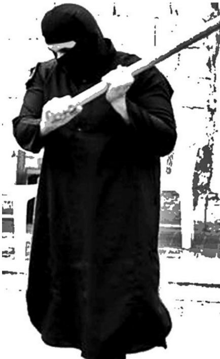
L'EI governa la ciutat de Derna des de l'octubre del 2014.