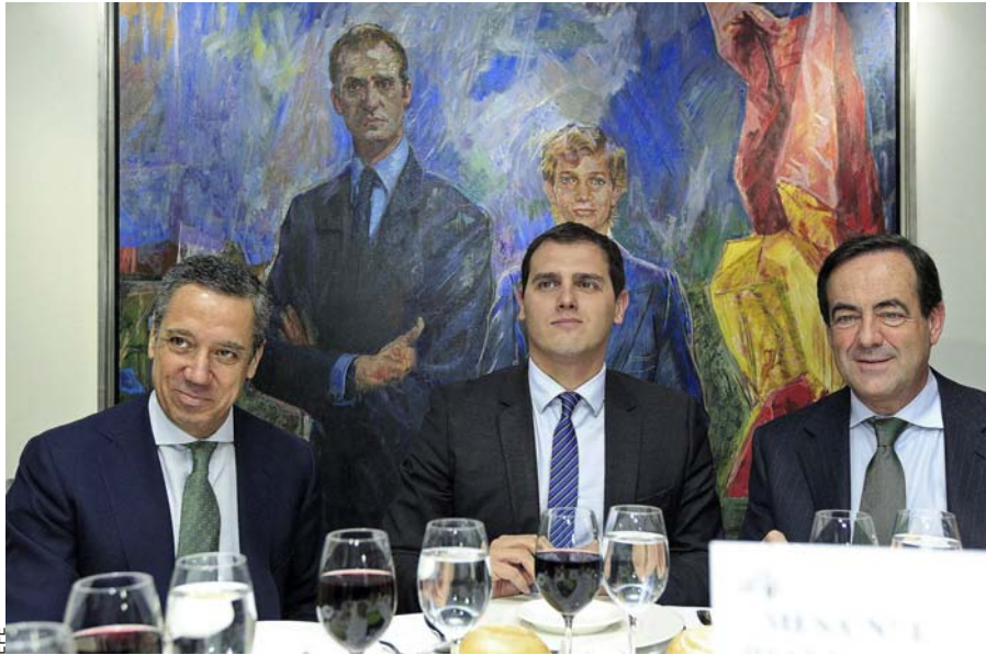
Eduardo Zaplana i José Bono escorten el líder de Ciutadans, Albert Rivera, a l'esmorzar informatiu que va protagonitzar a Madrid el 28 de maig del 2013. Poc després llançaria Moviment Ciudadà, la plataforma d'expansió estatal del seu partit.