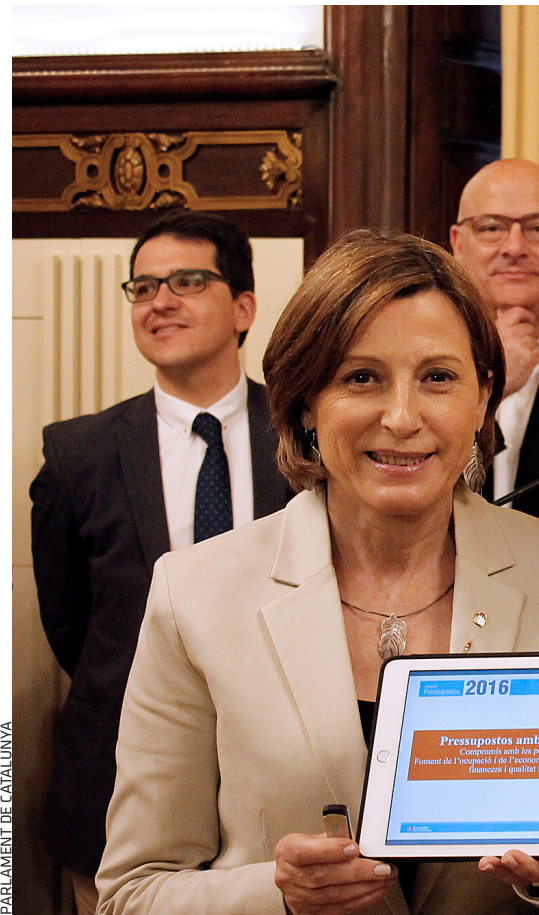
PARLAMENT DE CATALUNYA

PRESSUPOST SOCIAL. El vice-president i conseller d'Economia, Oriol Junqueras (dreta), lliura el projecte de llei de Pressupostos 2016 a la presidenta del Parlament, Carme Forcadell. Junqueras diu que la promesa d'un increment de 285 milions d'euros per al pla de xoc s'ha més que duplicat, amb un increment de 874,3 milions.