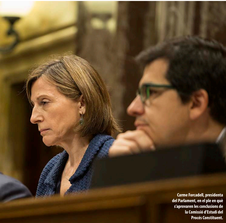
Carme Forcadell, presidenta del Parlament, en el ple en què s'aproven les conclusions de la Comissió d'Estudi del Procés Constituent.

membres del PP, Ciutadans o el PSOE que poden intentar culpar Forcadell.