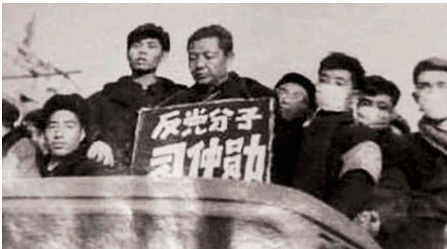
Xi Heping i Ai Qing en una imatge dels anys 40 i en una altra dels anys vuitanta, on es pot apreciar que el pare d'Ai Wei Wei té l'ull dret desfigurat.

→ glaçats amb un piolet, abans que els eliminés.